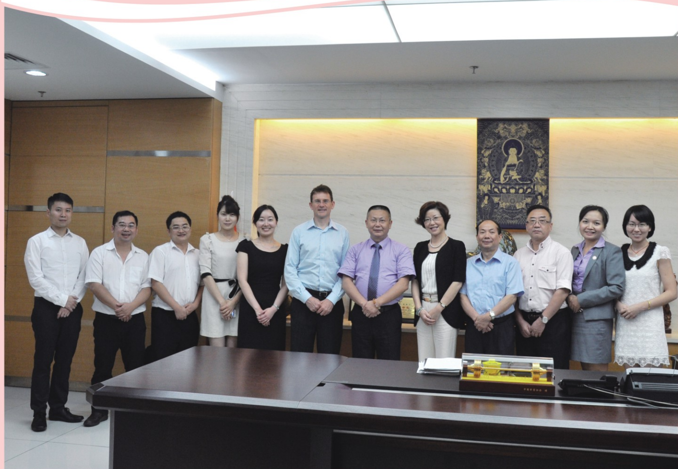
生命力集团携手Baker&Mckenzie、广东华商律师事务所完成上市法律尽职调查工作