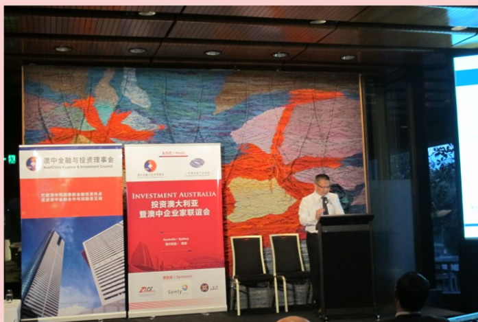
“2013澳大利亚投资会议暨澳中企业家联谊会”于2013年10月3日在澳大利亚悉尼市议会大厦礼堂成功举办