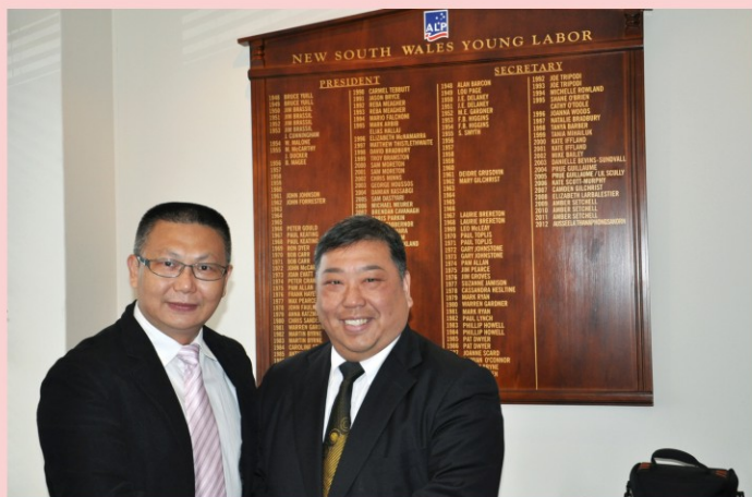
陈总与澳洲首位华人市长王国忠先生亲切合影